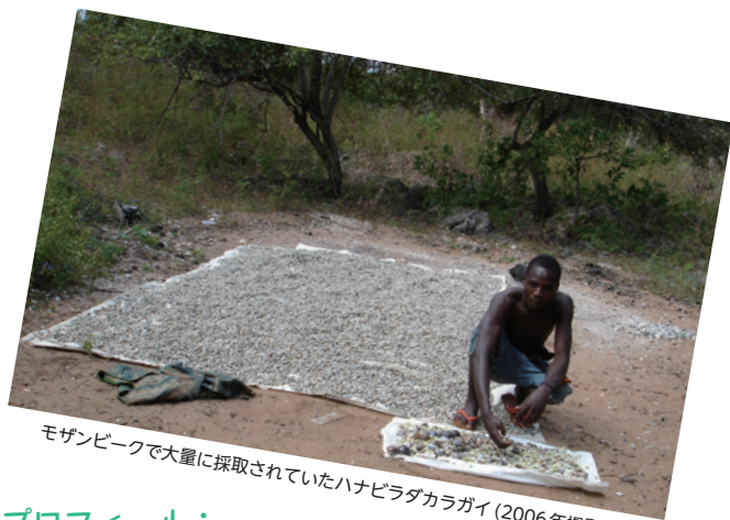
モザンビークで大量に採取されていたハナヒラダカラガイ(2006年撮影)

※ご応募いただいた方には当館より結果をお知らせします。 ※ご応募いただいた方の個人情報は、当館事業に関する目的以外では使用しません。