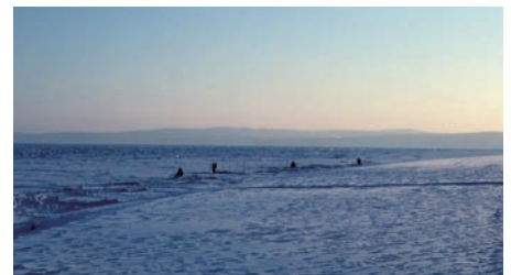
冬のアムール河での穴釣り