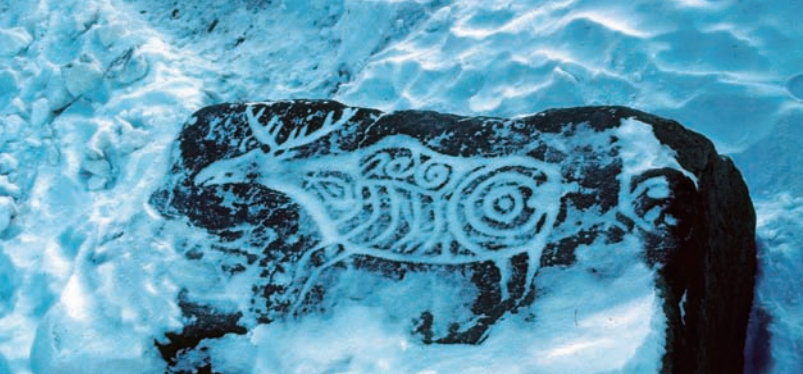
雪の中から浮かび上がるヘラジカ