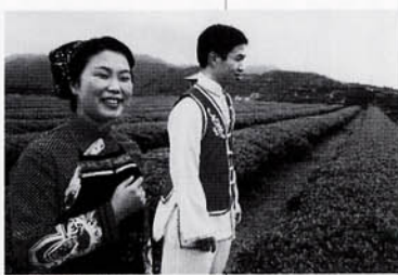
男女が茶指で掛け合いの歌壇をしている

茶俗のなかで特におもしろいのは「茶王戦」である。古代の「闘茶」の名残りだが、今は昔より盛んになっている。この一〇年、安溪の人びとは村、郷鎮、県レベルのほか、広州、上海、香港、アモイなどの都市でも盛大な「茶王戦」を開催して、「鉄観音」の