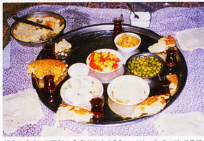
朝食の食卓。金属製の食卓(ジニ)のうえに、オリーブ、チーズ、サラダ、ヨーグルト、パンなどとともに、チャイがええられる

など総合的に楽しまれていくといえる。現在、トルコの村ではすくなくとも日に七、八回チャイを飲む。村の家々では、朝のおきがけや朝食時、昼食後、畑仕事の合間、夕食後、米食など多様な時間帯にチャイを用意する。これらのほかにおおくの男性たちは村のチャイ・ハネ(喫茶店)でチャイを飲む。チャイは、トルコの村の生活には不可欠な要素となっている。チャイなしの生活は、