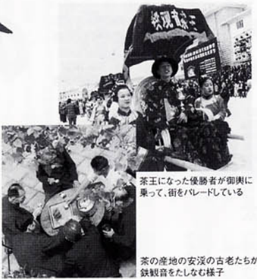
茶王になった優勝者が御輿に乗って、街をパレードしている