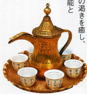
ヨルダンのコーヒーポットとカップ(現代)