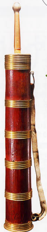
バター茶をつくるための攪拌器。チベット族・西藏自治区(標本番号 H11132)

社交の茶、もてなしの茶、薬用の茶、美容の茶、闘いの茶、くつろぎの茶……。茶をはじめ、コーヒーなどの嗜好飲料には、単にのどの渇きを癒し、水分を補給するという機能だけでなく、生を養う効能と生活を豊かにする愉しみがある。だからこそ、人類の喫茶の歴史には文化の香りがただよっているのである。 喫茶の歴史には文化の香りがただよっているのである。茶の活きた旨みを読んで味わいあれ。