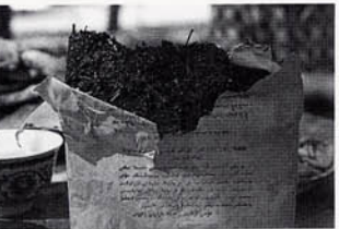
湖北省恩施州製造の磚茶

チベット族、ウイグル族などは茶葉を蒸して圧搾し、それに麴菌を発酵させて作った磚茶を使用する。大黃の資源調査でチベット族に会うこともしばしば