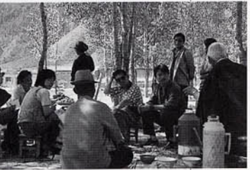
青海省海南藏族自治州での調査時に、奶茶の接待を受ける

であつたが、彼らの茶は酥油茶（バター茶）または奶茶（ミルク茶）であつた。酥油茶または奶茶では、茶を閉つて湯に入れ、よく煮沸させてからバターまたは新鮮な牛乳（ヤクの乳も使われる）、奶酪（一種のヨーグルト）及び若干の塩を加えて茶が作られる。肉食中心のチベット族では、バター茶や奶茶の飲用はビタミンCやフラボノイドの補給の上で最たるものであり、高山帯における乾燥や紫外線から身を守る上でも重要であると思われる。