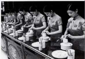
若い女性たちが茶芸を披露している

ロン茶は五四種類あり、鉄観音はそのうちの極上品で、「茶中の王」と言われ、一八世紀に当地で発見された。言い伝えによると、魏姓の男が毎日親音さまに焼香し、茶を供えていたところ、親音さまの夢を見て、その導きによつて、家の裏にある崖の上の岩間から蘭の香りのする茶樹をみつけたという。男