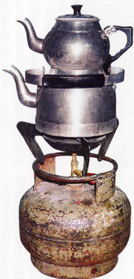
トルコの二段がさねのチャイ用ポット