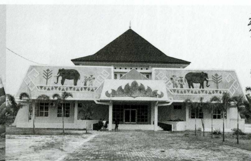
建設途中の本館正面。子どもたちの遊び場となっている