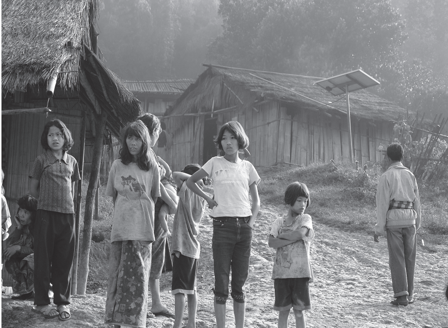
農耕民の村に囲まれて暮らす狩猟採集民ムラブリ (2008年、タイ)。

共同研究 ● 熱帯の「狩猟採集民」に関する環境史的研究 —アジア・アフリカ・南アメリカの比較から (2012-2014)