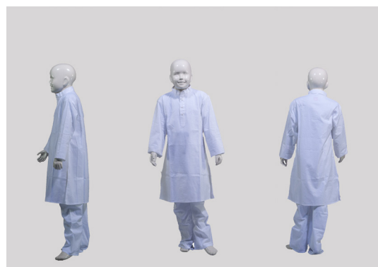
a kurta 上衣 〈クルター〉 b pajama ズボン 〈パージャーマー〉

男児用の衣装。クルターというゆったりしたシャツと、パージャーマーというパジャマ風のゆったりしたズボン。男性用の衣装の形態を子どものサイズにしたもの。