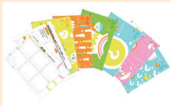
アクティビティ・カード

みんぱく見学時に活用できるワークシートをご紹介します。テーマに沿って本館展示を観覧できるものなど、見学に役立つさまざまなワークシートを揃えています。