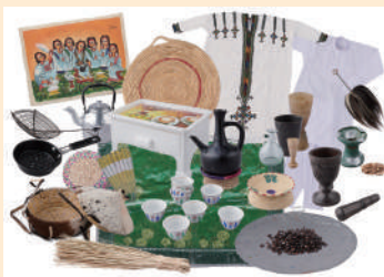
みんぱく「エチオピアのコーヒーセレモニー」

「みんぱく」は国や地域、宗教などのテーマごとに、衣装や生活にまつわるさまざまな道具などの実物資料と各種解説をスーツケースにつめ込んだ無料の貸出キットです。当日は、実際に実物を手に取ってご覧いただけます。