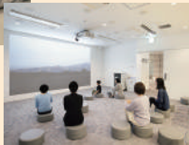
みんぱくシアター