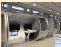
ビデオテークブース

みんぱく見学時にご利用いただける本館施設(食事・集合同所など)をツアー形式でご案内いたします。また、所蔵する映像資料を視聴できるビデオテークおよびみんぱくシアター、映像と音声を使って展示資料を解説する電子ガイドについてご紹介します。