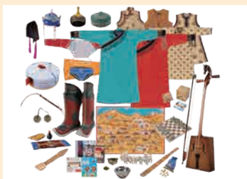
みんぱく「モンゴル 草原のおわりを楽しむ」

「みんぱく」は国や地域、宗教などのテーマごとに、衣装や生活にまつわるさまざまな道具などの実物資料と各種解説をスーツケースにつめ込んだ無料の貸出キットです。当日は、実際に実物を手に取ってご覧いただけます。