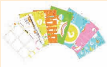
アクティビティ・カード

みんぱく見学時に活用できるワークシートをご紹介します。テーマに沿って本館展示を観覧できるものなど、見学に役立つさまざまなワークシートを揃えています。