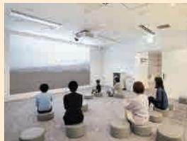
みんぱくシアター