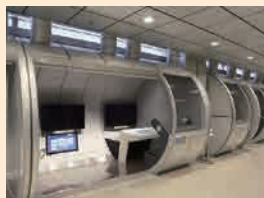
ビデオテークブース

みんぱく見学時にご利用いただける本館施設（食事・集場所など）をツアー形式でご案内いたします。また、所蔵する映像資料を視聴できるビデオテークおよびみんぱくシアター、映像と音声を使って展示資料を解説する電子ガイドについてご紹介します。