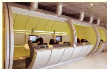
ビデオテークブース

みんぱく見学でご利用いただける本館施設(食事・集合場所など)をご案内いたします。また、所蔵する映像資料を視聴できるビデオテーク、映像と音声を使って展示資料を解説する電子ガイドについてご紹介します。