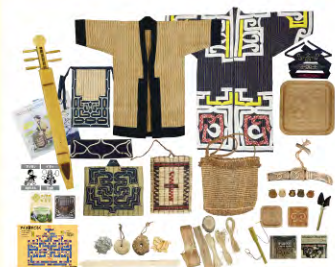
みんぱく 「アイヌ文化にであう」

「みんぱく」は国や地域、宗教などのテーマごとに、衣装や生活にまつわるさまざまな道具などの実物資料と各種解説をスーツケースにつめ込んだ無料の貸出キットです。当日は、実際に実物を手にとってご覧いただけます。