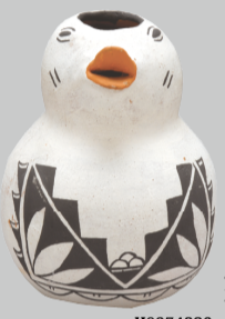
みず 水さし H0074886 アメリカ アメリカ南西部の先住民コ チティが作った土器の水さ しです。体には長寿や降雨 を願う祈りの羽根や雨雲が 描かれています。