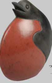
つちにんまよう じょうねつ 上人形「情熱の鳥」 H0210528 ベルー ペルー北海岸チュルカナス 村の土器で、ろうけつ染め に似た絵付けが特徴的です。 ペルーの海にはペンギンが 生息しています。