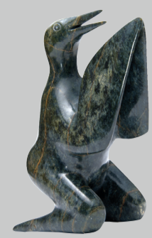
せきしょう とり せい 石彫「鳥の精」 H0227886 カナダ イヌイットの昔話によると、 人と動物はお互いに変身で きました。鳥が人間のよう に祈っている姿を描き出し たアート作品です。