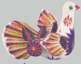
ろうそく立て H0153941 メキシコ メキシコの陶芸の産地メテ ペックで作られた陶器のろ うそく立てです。鳥の背中 の穴にろうそくを立てて、 灯をともします。

9-12月9日開催予定 開館40周年記念企画展 「カナダにおける先住民文化の 過去、現在、未来」(仮)