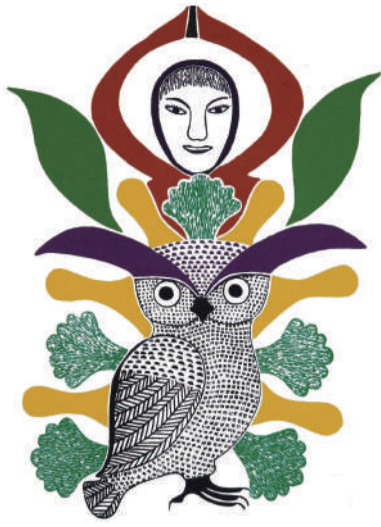
●版画「夏のフクロウ」