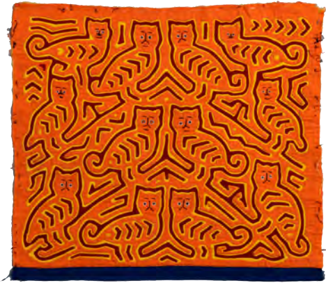
モラ(飾り布) パナマ共和国

南北アメリカ大陸の境界に位置する国、パナマの先住民族グナは、何枚もの布を重ねて「モラ」という手芸を制作しています。動物や植物、幾何学模様をモチーフにした色あざやかなモラは、リバースアププリケという技法で作られます。ワークショップでは色画用紙を用いてモラのデザインに挑戦します。