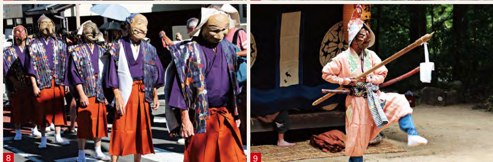
1. 梶の屋神楽(鳥根県雲南市) 2. 悪石島のボゼ(鹿児島県十島村) 3. 平塩舞楽(山形県寒河江市) 4. 西金砂神社田楽舞(茨城県常陸太田市) 5. 八朔太鼓踊りのメンドン(鹿児島県三島村) 6. 千本ゑんま堂大念仏狂言(京都府京都市) 7. 稻佐神社のくんの獅子舞(佐賀県白石町) 8. 御霊神社の面掛行列(神奈川県鎌倉市) 9. 上鴨川住吉神社神事舞(兵庫県加東市)