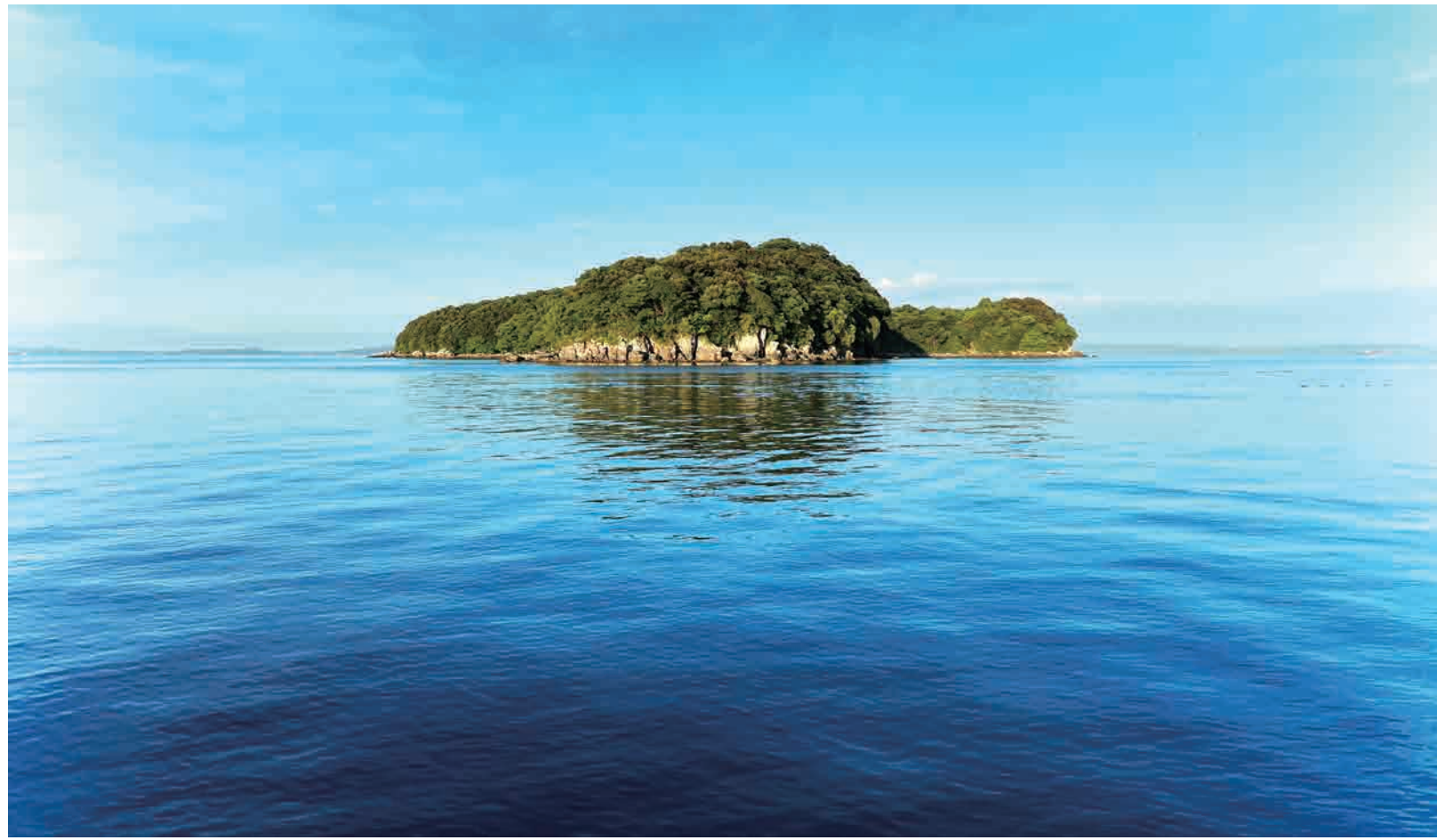
明神が鼻からみた恋路島 (2023)