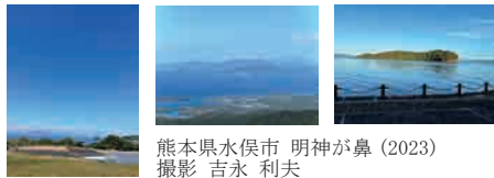
熊本県水俣市 明神が鼻 (2023)