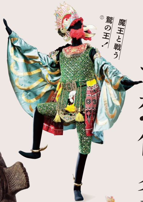
① 魔王と戦う 驚の王!