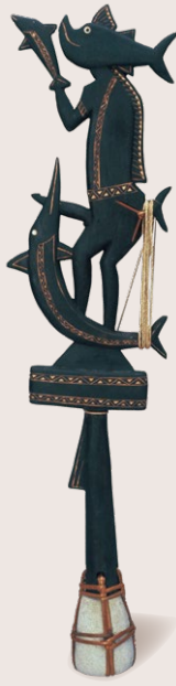
人? 動物? 飛んでる? 泳いでる? 歩いている?