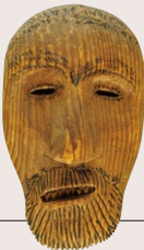
仮面(千島列島) 国立民族学博物館蔵

千島アイヌが怖れる 化物の木製仮面 アイヌの中でも千島アイヌにしか伝わっていないフジル! 仮面の下は「のつべらぼう」近隣諸民族の仮面と関係か? 千島アイヌの伝承を採録した鳥居龍蔵のフィールドノートと共に展示される稀少な機会。