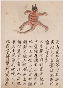
海鬼、「廻國山海鏡」(1762)より 東北大学附属図書館蔵 ※会期中資料替えがあります

未知なる世界の驚異や、常ならざる怪異は、どのように描かれ、理解されてきたのでしょうか? 博物誌や世界地図、現代アーティストたちの作品に探る、アジア、中東、ヨーロッパの比較怪物学。