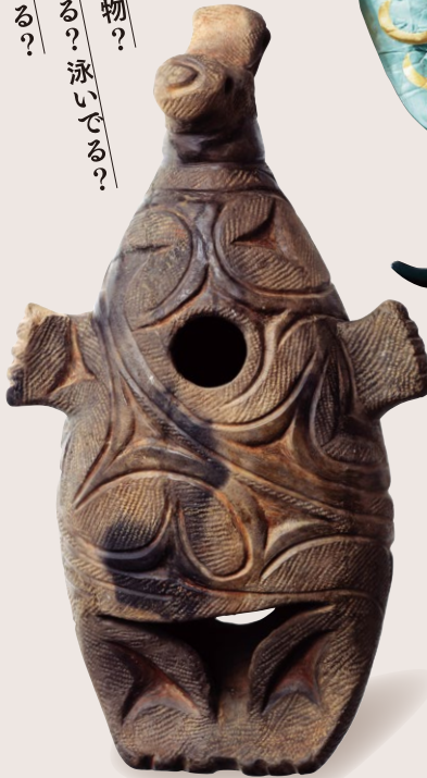
⑤ 怪しい灯の 正体は?