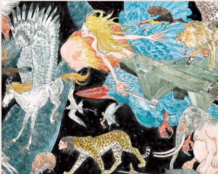
五十嵐大介作「異類の行進(マーチ)」(部分)