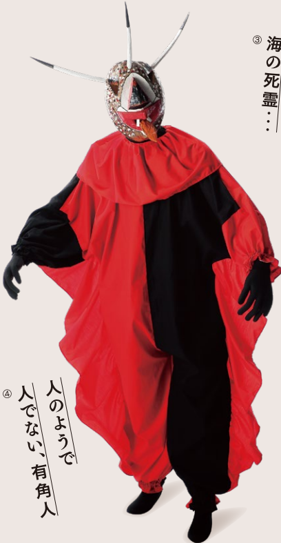
③ 半魚人は 海の死霊…

人類は、常識や慣習から逸脱した「異」なるものを、どのように認識し、説明し、描いてきたのでしょうか。本展は、人魚や龍、河童など、想像界の生きもの多様性について絵画や書籍、祭具などをとおして紹介し、人間の想像と創造の力の源泉を探ります。奇妙で怪しい、不気味だけれどかわいい、世界の霊獣・幻獣・怪獣が大集合! 本展は「国立民族学博物館 大阪府吹田市」にて2019年秋に開催された特別展「驚異・怪異・想像界の生きものたちの巡回展」です。