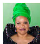
モハウ・ペコ大使