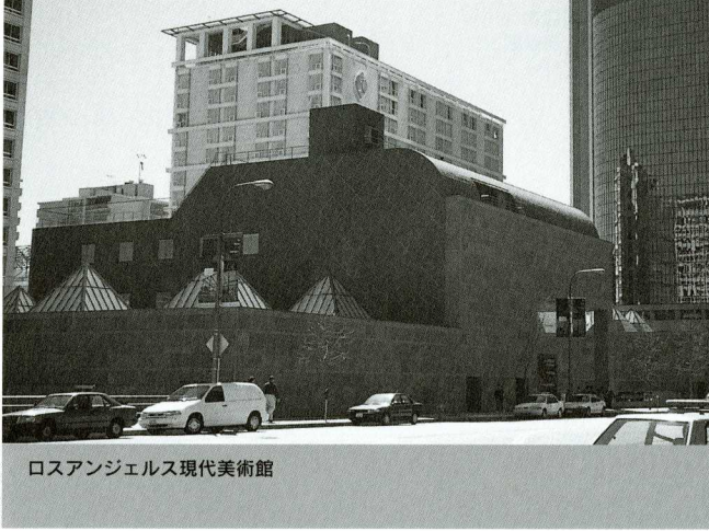
ロスアンジェルス現代美術館

役割が重要な位置をもっていることから理解されるだろう。近代美術は美術史という自らを正統化する言説場を作り出すことよって、そのなかに自らを織り込んで自らの物語を普遍的なもの、正統的なものとして社会に提示する制度を再生産してきた。