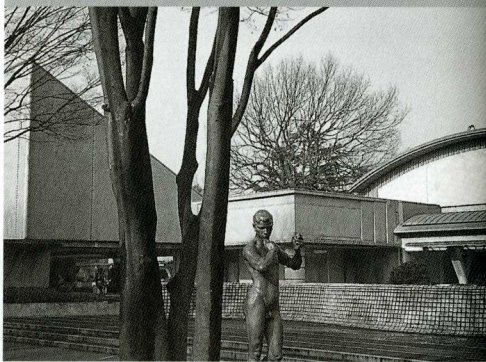
世田谷美術館(東京)