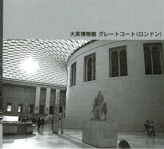
大英博物館 グレートコート (ロンドン)