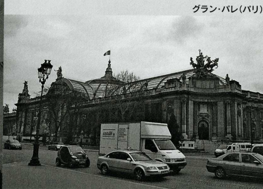
グラン・パレ(パリ)

たように、森ピルの経済的成功をアートによって浄財化してみせようという倫理的要求をそこに見るのは間違っていないだろう。