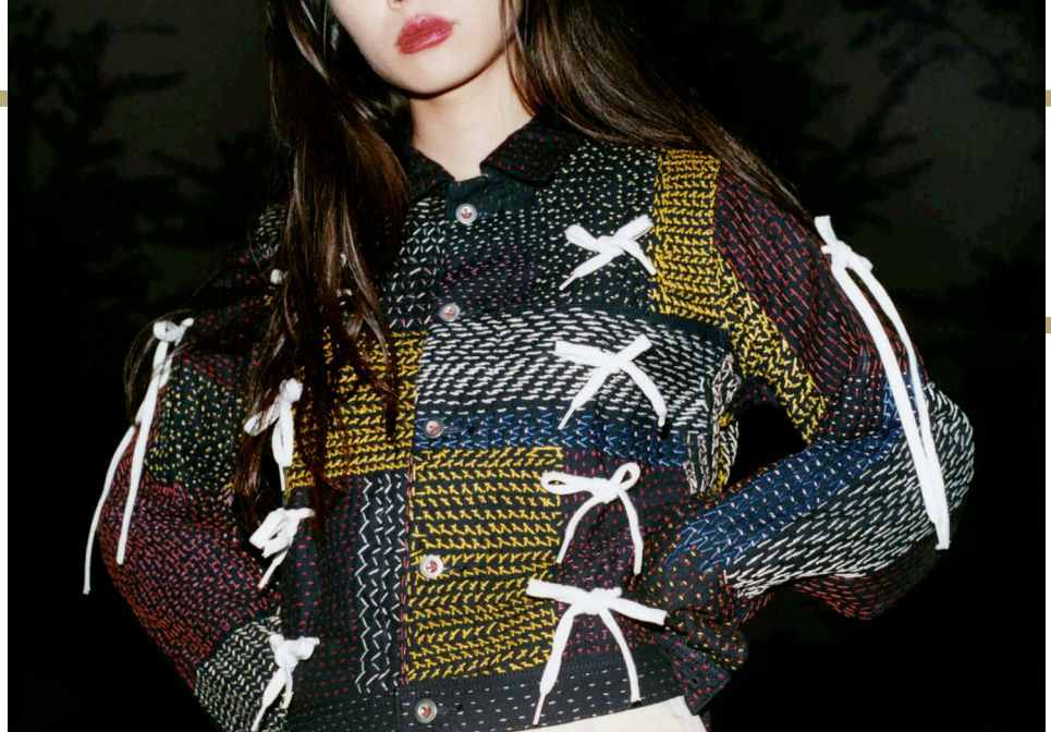
zaziqo 2017年春夏コレクションより。

近代ファッションの歴史は大量生産、大量消費とともにあり、その速度は増すばかりである。そこに「手芸」をもちこむことは、新しい風を吹き込むことになるのだろうか。