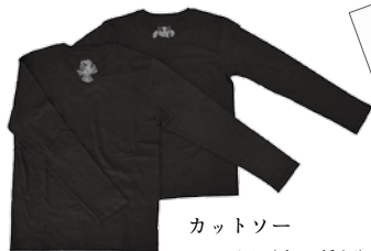
カットソー 2,300円 (全2種類) 色: ネイビー サイズ: S, M, WM, L, WL

観覧後はミュージアム・ショップにもお立ち寄りください。本展の図録とあわせ、オリジナル商品、めずらしいビーズのアクセサリなど、多数そろえています。注目していただきたいのは、2階で展示中のビーズアートのアーティストの方々の作品です。みなさまのお越しをお待ちしております。