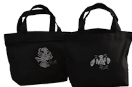
トートバッグ 1,000円 (全2種類) 色: ネイビー

特別展図録 『ビーズ—つなぐ・かざる・みせる』 池谷和信 編 国立民族学博物館発行 全136ページオールカラー、B5変形判 1,100円