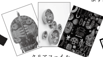
クリアファイル (A4サイズ) 各330円 (全3種類)