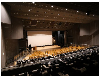
講堂（みんぱくインテリジェント・ホール）

※懇談会終了後、リニューアルオープンした音楽展示場の福岡教授による解説及びリニューアルオープンした講堂（みんぱくインテリジェント・ホール）の館長による解説も予定しております。