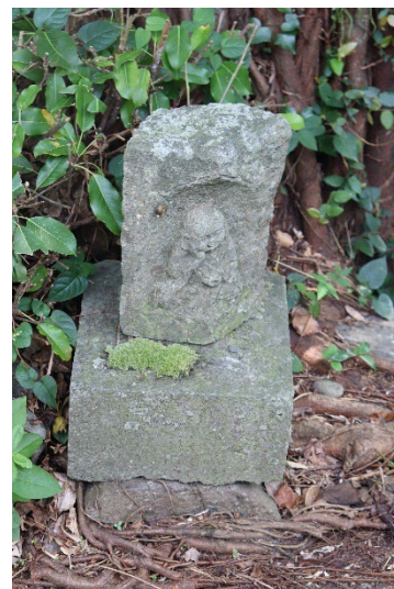
水俣市明神が鼻の魂石

会 期：2024 年 6 月 18 日(火)まで 会 場：国立民族学博物館 本館企画展示場 観覧料：一般 580 円 (490 円)、 大学生 250 円 (200 円)、高校生以下 無料 ※ ( ) は 20 名以上の団体料金 / リピーターは団体料金を適用 ※本館展示もご覧いただけます