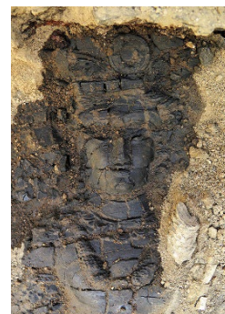
出土直後の女神ナナの頭部