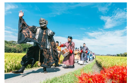
明日香村で演じられたGIGAKU （2025年）