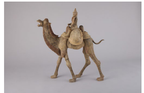
ソグド商人像（特別展で展示予定） 浜名梱包輸送シルクロード・ミュージアム蔵

問い合わせ 国立民族学博物館友の会（公益財団法人 千里文化財団） 電話 06-6877-8893