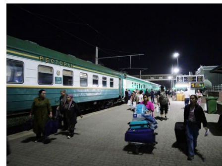
暮夜のタシュケント南駅 撮影：黒田賢治、ウズベキスタン、 2024年