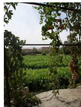
調査隊ベースキャンプから遺跡を望む 撮影：黒田賢治、2024年