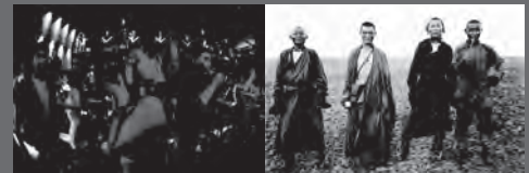
3. チョコ・ナイトクラブ / 2017年 4. 草原の若者たち / 1909年

100年前のモンゴルと現在のモンゴルが 時空を越えて本館で出会う、体験型の「写真 展」です。外国の探検家たちが写した100 年前のウランバートルは、大活仏の座する宗 教都市でした。一方、現代の首都の素顔を気 鋭のモンゴル人写真家が写し出します。大草 原と遊牧民とは異なるもう一つのモンゴルと の出会いです。