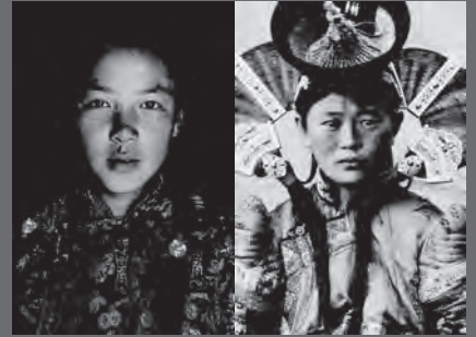
1. ある少女 / 2016年 2. ウルガの女性(部分) / 1909年